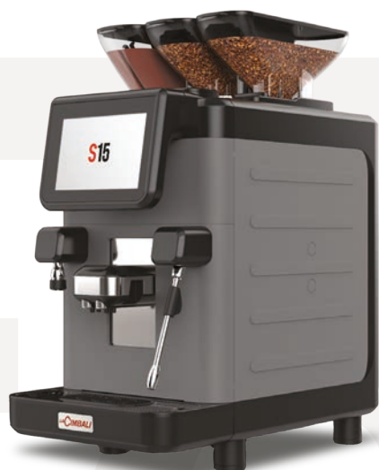
LaCimbali S15 – Vista frontal y vista frontal ¾

Sistema de chocolate em pó incorporado, bem como circuito de leite para receitas de leite montado quente. Ambos os sistemas são fornecidos com sistema de lavagem automática.