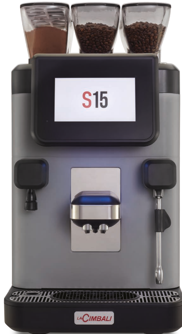
LaCimbali S15 – Vista frontal e ¾ frontal