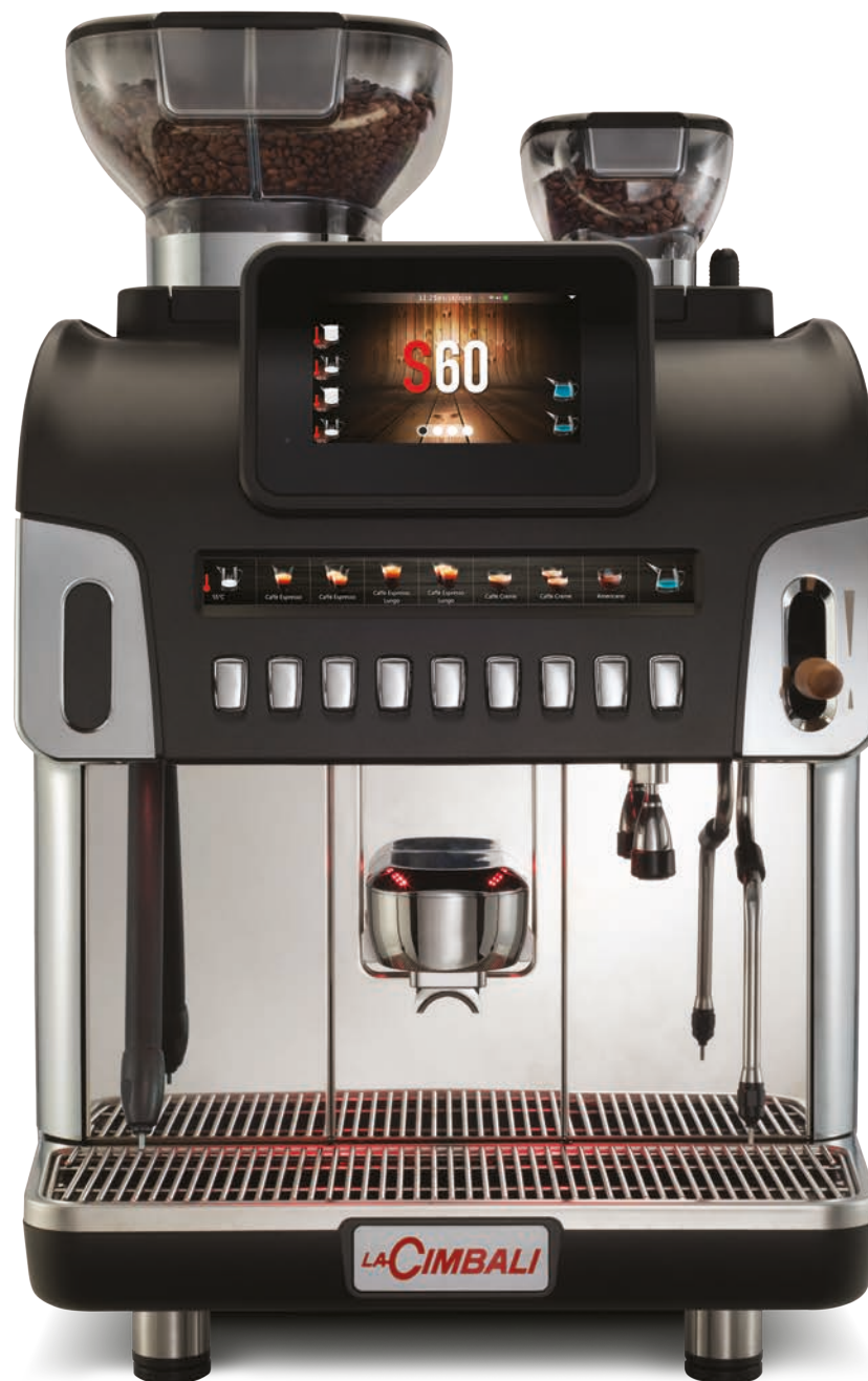
LaCimbali S60 – Vista frontal e ¾ frontal