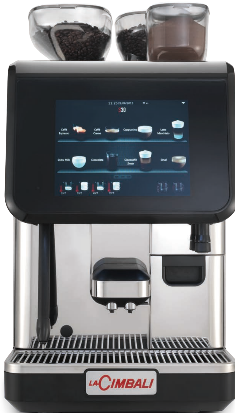
LaCimbali S30 – Vista frontal y vista frontal \frac{3}{4}

Lança de vapor automática que permite programar 4 receitas de leite com ou sem espuma. Ainda mais fácil de usar e limpar.