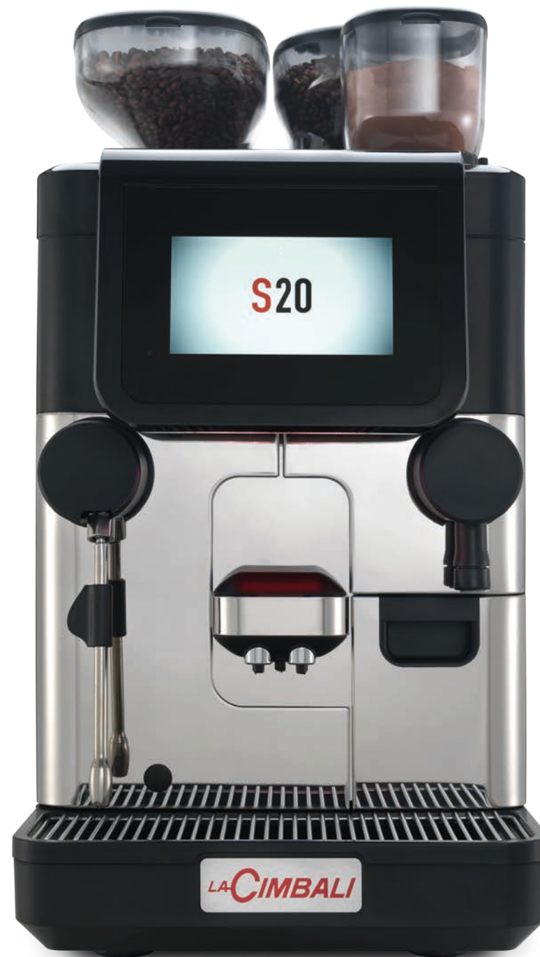
LaCimbali S20 – Vista frontal e \frac{3}{4} frontal