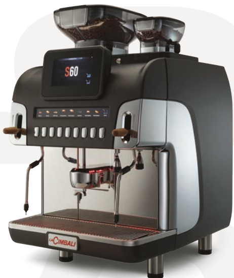
LaCimbali S60 – Vista frontal y vista frontal ¾

Máquina inteligente com telemetria bidireccional, função de controlo remoto e a app CUP4YOU.