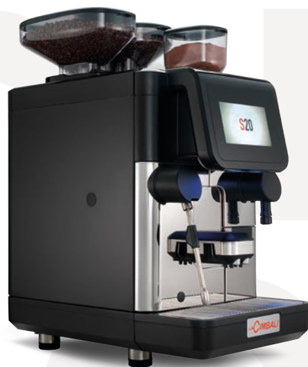
LaCimbali S20 – Vista frontal y vista frontal \frac{3}{4}

Caldeira individual de grande capacidade para excelentes prestações em termos de água quente e vapor, inclusive nas horas de ponta.